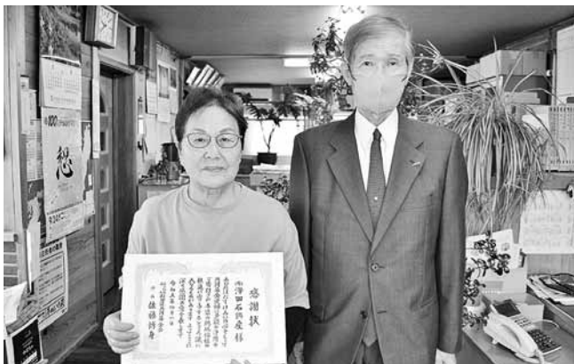
有限会社澤田石興産 様