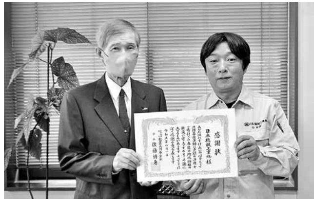
日本機械工業株式会社 様