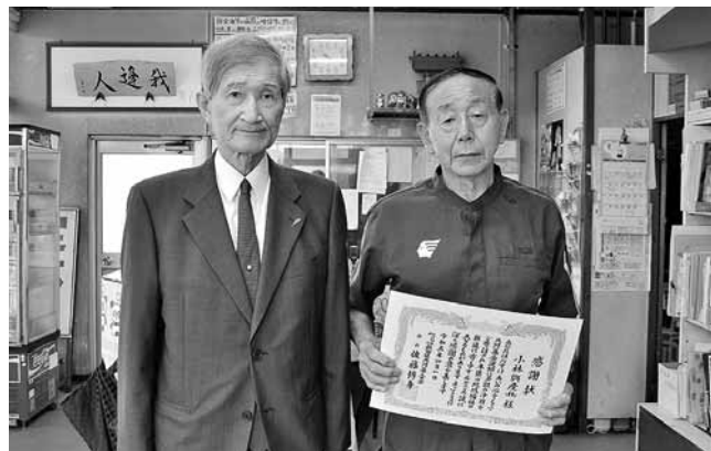
小林興産株式会社 様