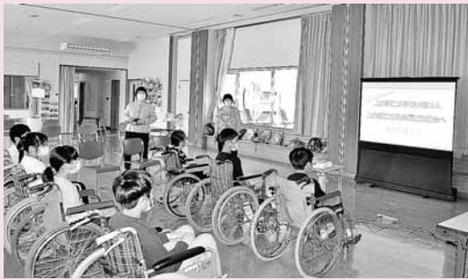
▶講話中は車椅子に座っていただきました

上小阿仁小学校4年生の皆さんの「総合的な学習の時間」の今回のテーマは『見つけよう！上小阿仁村のやさしさ』。当協議会にて事務局長が「福祉」に関する講話を行ったあと、小学生の皆さんは村の元気サロンに参加してご高齢者の方々と楽しく交流しました。