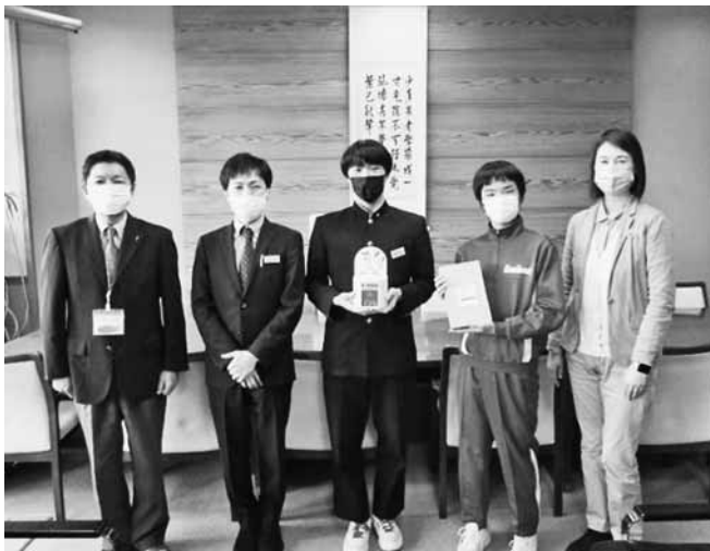
▲子どもたちの善意が託されました

集められた募金は、子どもたち、 高齢者、障がい者などを支援するさ まざまな福祉活動や、災害時支援に 役立てられます。 ありがとうございます。